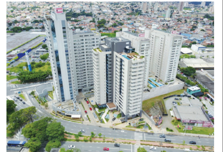
Marco Zero, complexo misto da MBigucci em São Bernardo