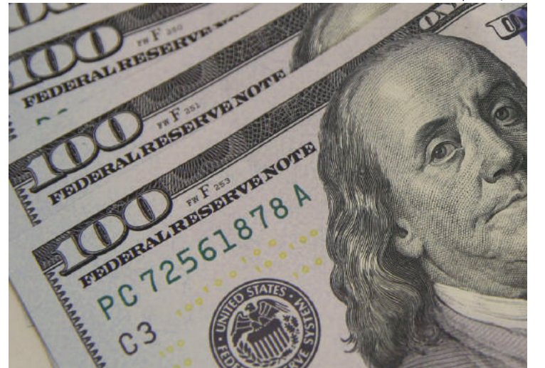
Dólar comercial encerrou o dia vendido por R$ 4,935